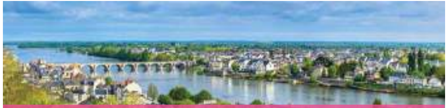
CASTILLO DE LOIRA

Breve Panorámica Para apreciar su famoso puente de piedras sobre el Río Garona.