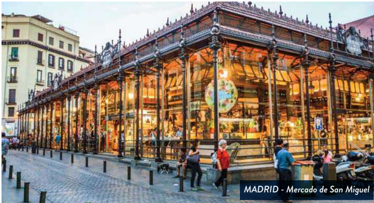
MADRID - Mercado de San Miguel

Desayuno en el hotel. Visita panorámica de la ciudad pasando por sus monumentos y calles más importantes. Plaza de Toros de las Ventas, paseo de la castellana donde se sitúa el Madrid financiero y el estadio Santiago Bernabéu. La Plaza de Cibeles, puerta de Alcalá y la Gran Vía, su avenida más cosmopolita. Continuaremos por Plaza de España y Plaza de Oriente donde se sitúa el imponente Palacio Real. A partir de ese momento, continuaremos a pie para explorar el Madrid más antiguo, llamado de los Austrias, caracterizado por