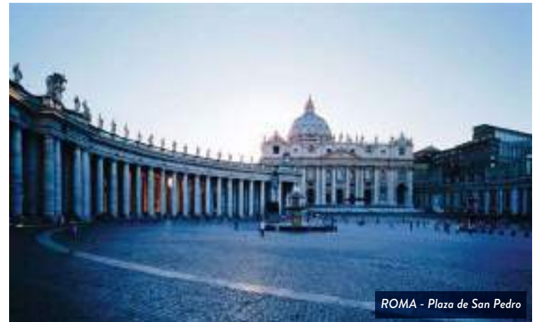
ROMA - Plaza de San Pedro

el Circo Máximo, el Campidoglio, el teatro de Marcello, el Coliseo, el Foro Romano, la Piazza Venezia, el Castel Sant'Angelo, la plaza y la basílica de San Pedro (visitas externas). Resto del día libre. Al finalizar la visita panorámica, le ofrecemos la posibilidad de efectuar la visita opcional de los Museos Vaticanos, la Capilla Sixtina y el interior de la Basílica de San Pedro, evitando las posibles largas filas de espera, con nuestro tour opcional "con reservas incluidas".