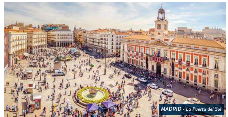
MADRID - La Puerta del Sol

Tiempo libre en los alrededores de la Plaza Mayor, donde se encuentra el famosísimo Mercado de San Miguel para almorzar (no incluido) siguiendo la tradición del país, con su sistema de tapas y raciones. Resto del tiempo libre con posibilidad de realizar una excursión opcional a la ciudad de Toledo, situada a 70 km de la capital. Toledo fue la antigua capital de España. Sus calles y monumentos fueron el escenario de su historia. Su visita será un auténtico viaje al pasado. Aparte de recorrer el barrio musulmán, cristiano y la judería, visitaremos el interior de la catedral, una auténtica biblia en piedra, cuya bóveda está sujeta por 88 columnas y donde además de su magnífico coro, y altar mayor, admiraremos una gran colección de obras de El Greco y la Sacristía. Regreso al hotel. Alojamiento.