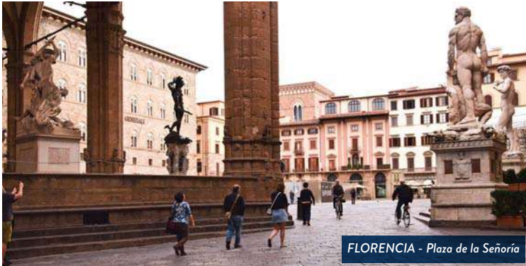
FLORENCIA - Plaza de la Señoría

Duomo, con la espectacular cúpula de Brunelleschi. Continuaremos hacia la Plaza de la Signoría, que fue el corazón político de la Florencia de los Medici.