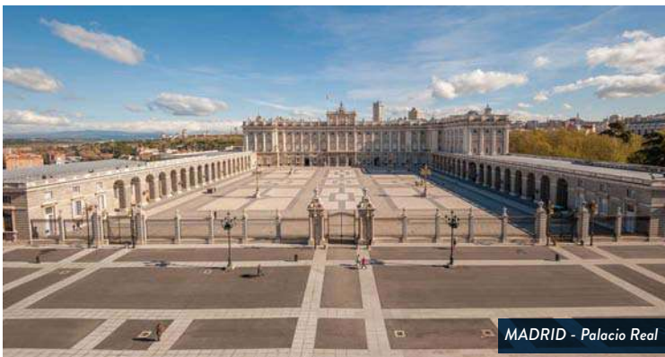
MADRID - Palacio Real

Resto del día libre con la posibilidad de realizar un tour opcional para asistir a uno de los mejores espectáculos de flamenco de España, tomando una copa a su elección. Además, de camino, recorreremos calles muy emblemáticas de la capital, con su ambiente nocturno y descubriremos lo viva que está esta ciudad. Alojamiento en Madrid.