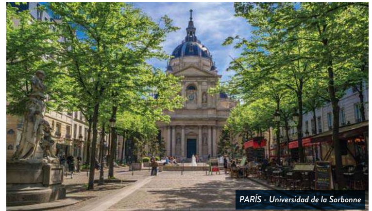
PARIS - Universidad de la Sorbonne

Desayuno en el hotel. Por la mañana efectuaremos una amplia visita panorámica de la ciudad, recorriendo los Campos Eliseos, su Arco del Triunfo, la Place de la Concorde, el impresionante Louvre, el museo D'Orsay, l'Hotel de Ville, la Catedral de Notre Dame, el Panteón, el Barrio Latino, la universidad de la Sorbonne, los Invalidos, el Palacio de Luxemburgo, la Opera y naturalmente, la Tour Eiffel (visitas externas). Resto del día libre.