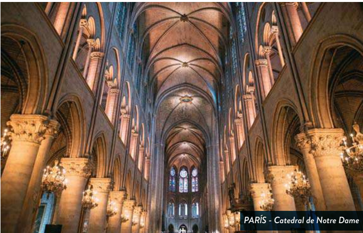
PARIS - Catedral de Notre Dame

Desayuno en el hotel. Por la mañana efectuaremos una amplia visita panorámica de la ciudad, recorriendo los Campos Eliseos, su Arco del Triunfo, la Place de la Concorde, el impresionante Louvre, el museo D'Orsay, l'Hotel de Ville, la Catedral de Notre Dame, el Panteón, el Barrio Latino, la universidad de la Sorbonne, los Invalidos, el Palacio de Luxemburgo, la Opera y naturalmente, la Tour Eiffel (visitas externas). Resto del día libre.