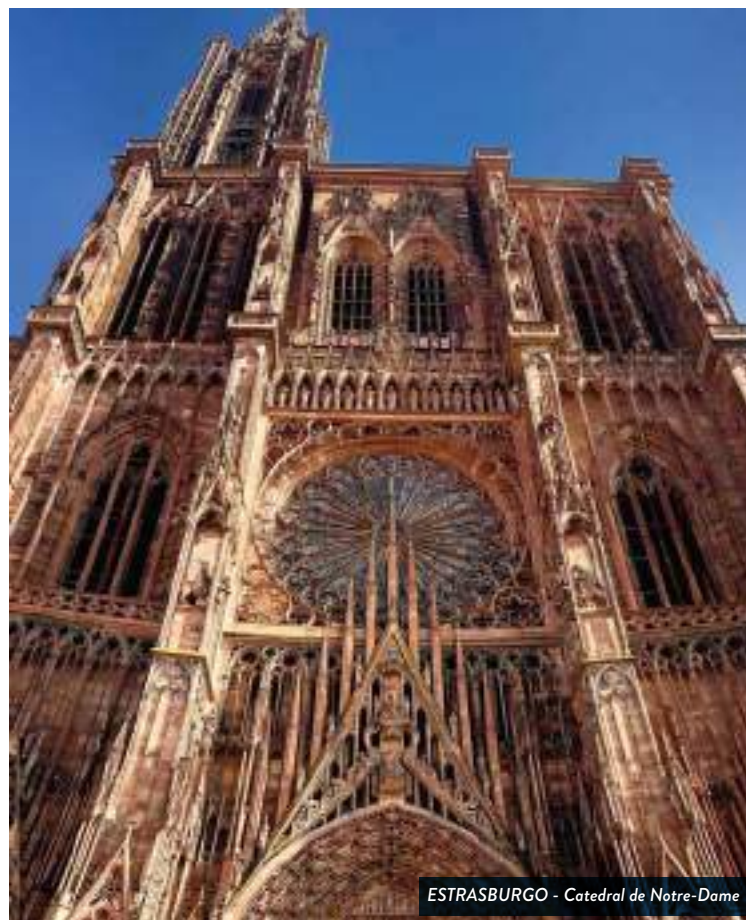
ESTRASBURGO - Catedral de Notre-Dame

Desayuno en el hotel. A la hora indicada tendrán el traslado privado de salida al aeropuerto para su regreso.